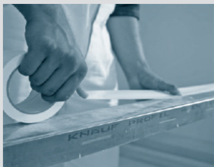
1. Притискане на Кнауф Trenn-Fix лентата върху CD-/UW-профил

При бояджийски работи разделителната фуга трябва да бъде продължена и в зоната на свързване.