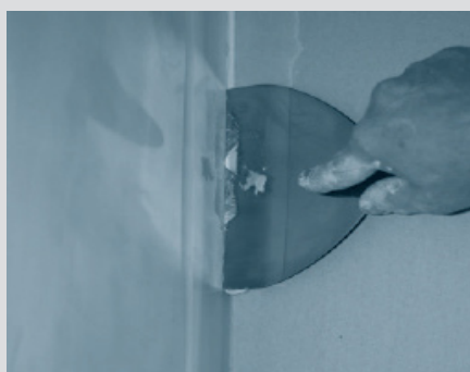
5. След монтирането на плоскостите се нанася шпакловка