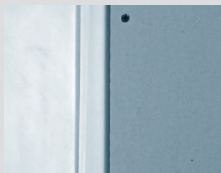
4. Плоскостите се монтират на върху разстояние 5 mm една от друга