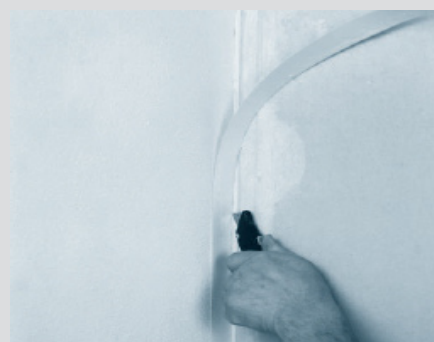
6. След изсъхване свободните краища се изрязват