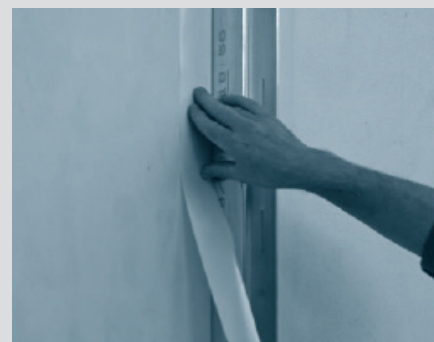
3. Алтернативно Кнауф Trenn-Fix може да се залепи върху строителния елемент